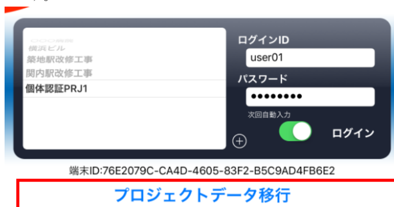
図 3-1 【旧 CheX】 ログイン画面

② 【旧 CheX】 ログイン画面中央にある「プロジェクトデータ移行」ボタンをタップします。